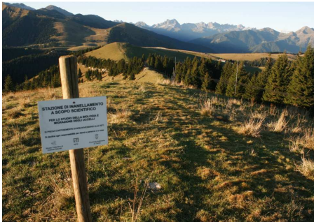
Impianto di cattura