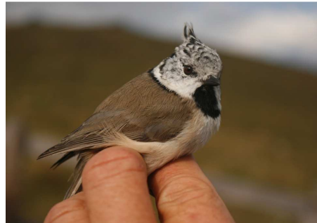
Cinzia dal ciuffo