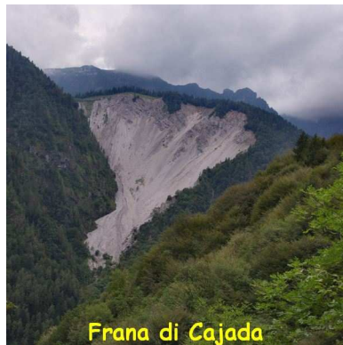
Frana di Cajada